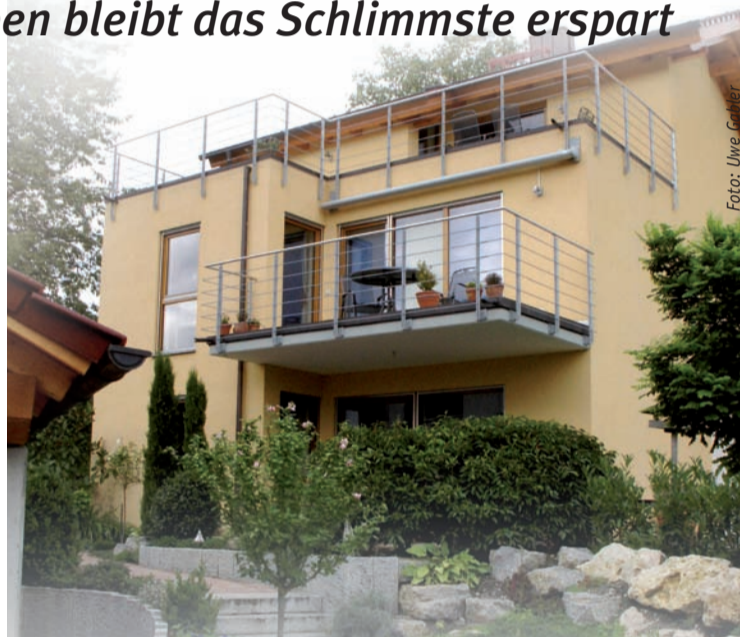
Eine selbst bewohnte Immobilie kann steuerfrei vererbt werden.

Auch die zweite Variante setzt das Erfüllen von drei Bedingungen voraus: Wenn Firmenerben das Unternehmen zehn Jahre lang weiterführen, müssen sie keine Erbschaftsteuer zahlen, wenn sie zusätzlich die Lohnsummenklausel mit insgesamt 1.000 Prozent einhalten und das Verwaltungsvermögen des