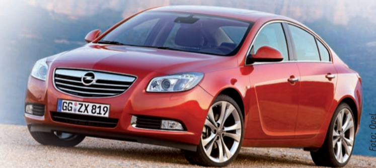
Fahrzeuge mit der Abgasstufe Euro 5 und 6, wie dieser Opel Insignia, sind ein Jahr lang von der Kfz-Steuer befreit.

Mit einem zusätzlichen Sicherheitsnetz für Beschäftigte, das in der Krise greift, wird die Bundesregierung Beschäftigungssicherung mit Weiterqualifizierung verknüpfen. Über